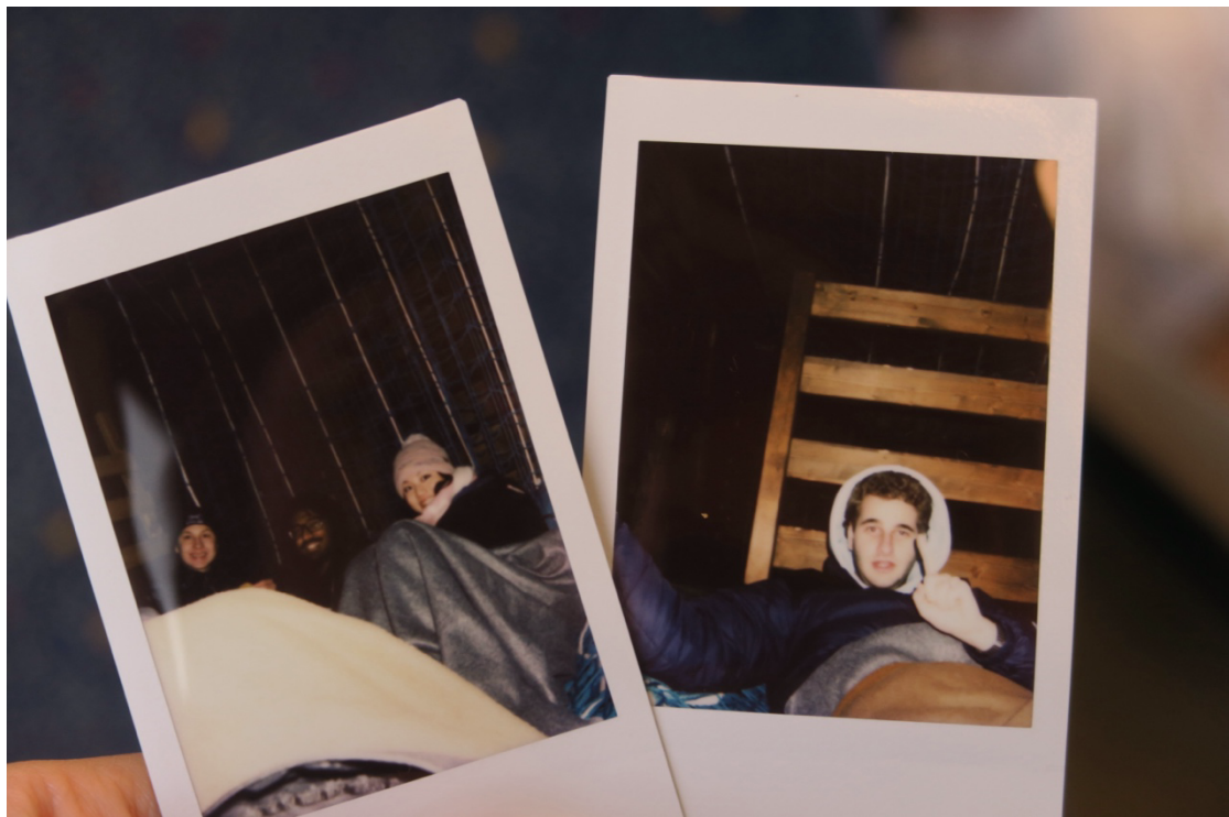
( 17.12.2025 與來自澳洲及烏克蘭的朋友去瑞士旅行 )

限制是行李大小只有一個後背包，並且前 24-3 小時前必須線上報到否則會被罰錢 ( 這是 Ryanair，實際情況依航空公司規定而異 )。票價亦會因季節有所不同，秋冬為歐洲旅遊淡季，通常機票更便宜。