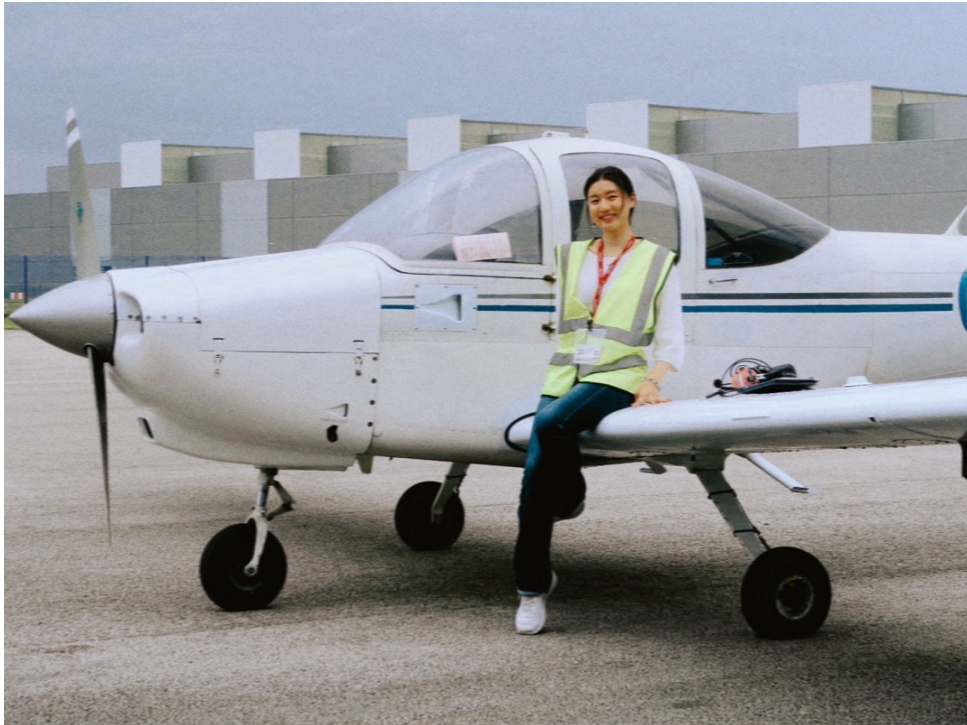
( 13.06.2025 最後一次學飛 PA-38 )

課程要求每堂課都需事先閱讀指定資料。對於第一次接觸北愛爾蘭政治的人來說，許多歷史與名詞一開始顯得相當抽象難懂，需要花時間釐清其中複雜的國內外政治糾葛；不過，我很欣賞教授十分樂於傾聽不同政治立場的觀點，而你表述的所有思想都是被大家尊重的。印象深刻的是，在課堂上當同學們第一次聽到台灣的歷史背景時，甚至驚訝地發現其中與北愛衝突有幾處雷同，還當場查找資料來詢問我，這讓課程討論變得更加多元！參訪報告，並繳交一篇期末千字論文作為評量。