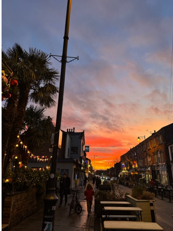
( 15.12.2025 Lark Lane 傍晚夕陽 )