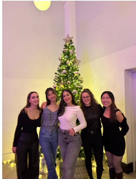
(10.12.2025 Fairwell Event )

總結來說，只要勇於踏出第一步，積極參與活動，無論是課堂、社團或校園活動，都能找到志同道合的好朋友！